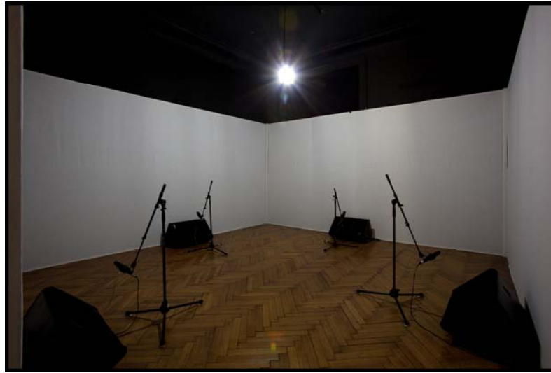
receive - send - receive , Rombout Willems

Met de geluidsinstallatie receive-send-receive (2009) creëert Rombout Willems een auditief beeld met feedback, gegenereerd door de aanwezigheid van de toeschouwer.