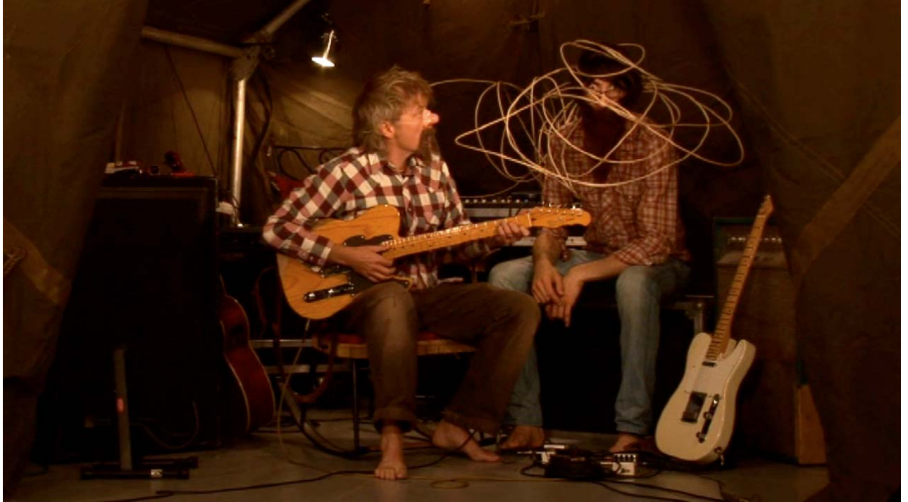
The OHNO Cooperation Conversation On The O.H.N.O.P.O.P.I.C.O.N.O. Ontology