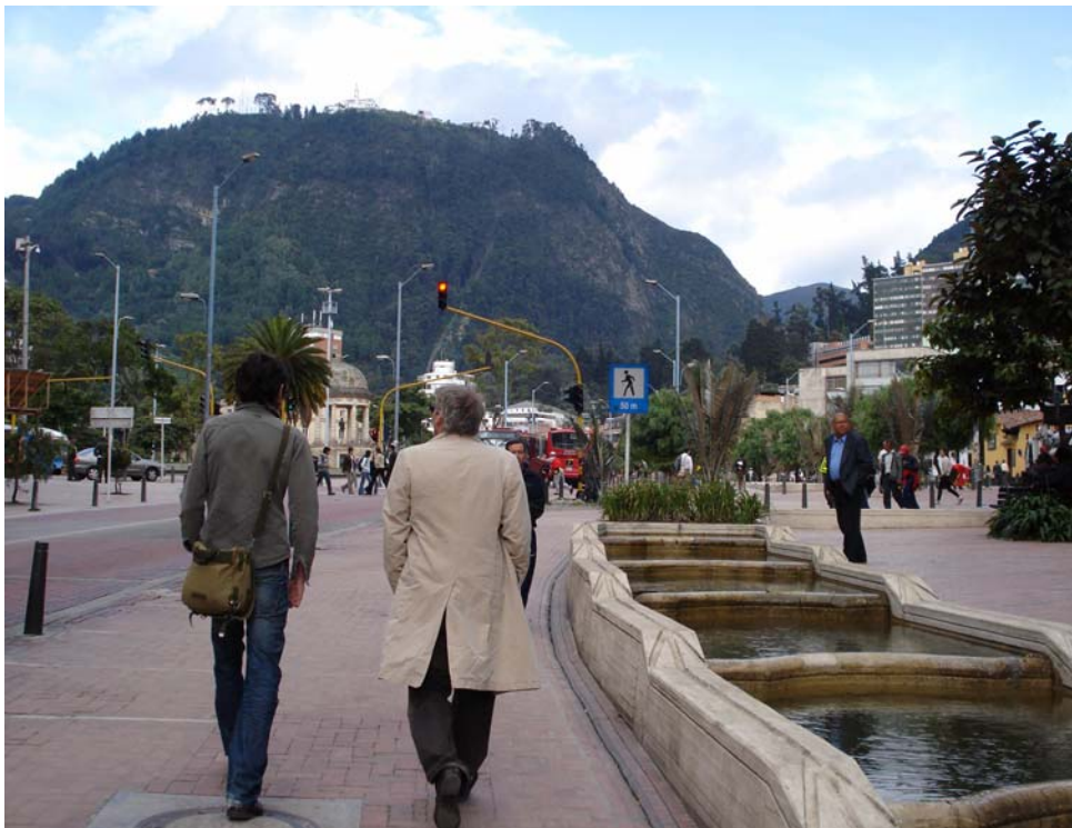
OHNO COOPERATION

Jan Lauwers : 'C'est le plus petit projet au sein de Needcompany, mais pour moi, il est aussi nécessaire qu'un grand projet comme la trilogie Sad Face | Happy Face . Les actions ohno sont pour mon cerveau un grand nettoyage.'