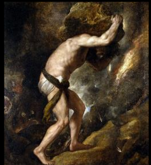
Titiaan, 'Sisyphus'. Olie op doek. 1548-1549.

Tough Shit spiegelt zich aan een personage uit Pieter Bruegel de Oude's 'Strijd tussen Carnaval en de Vasten' waarin een humaan, onbehaaglijk beeld van het alledaagse leven geschilderd wordt: een kreupele man die zonet kleine houten speelgoedpaardjes zonder kop in de handen geduwd heeft gekregen om zich mee voort te trekken, schuurt zijn borst over de onverharde en rioleringsloze dorpsbaantjes, om het niet met zijn nagels te moeten doen. Tough Shit omarmt dit absurd volharden van Bruegels personages, en vindt zijn gelijke ook terug in Sisyphus van Albert Camus. Sisyphus – die als de sterveling in opstand kwam tegen de goden en daarvoor de meest ernstige straf denkbaar opgelegd kreeg: zinloosheid – werd gedoemd eeuwig een rots de berg op te duwen, te kijken hoe deze weer naar beneden rolt en opnieuw te beginnen. Sisyphus als de ultieme absurde held. "We moeten ons Sisyphus als een gelukkig mens voorstellen", schrijft Camus.