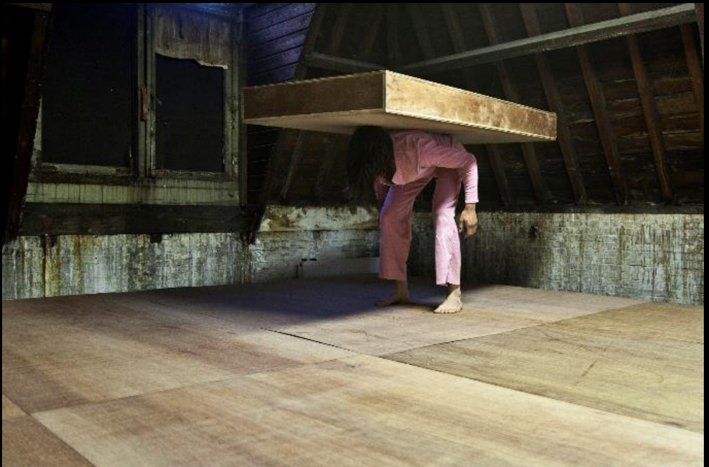
Oninteressant Resultaat, Maarten Seghers, © Anu Vahtra, 2011