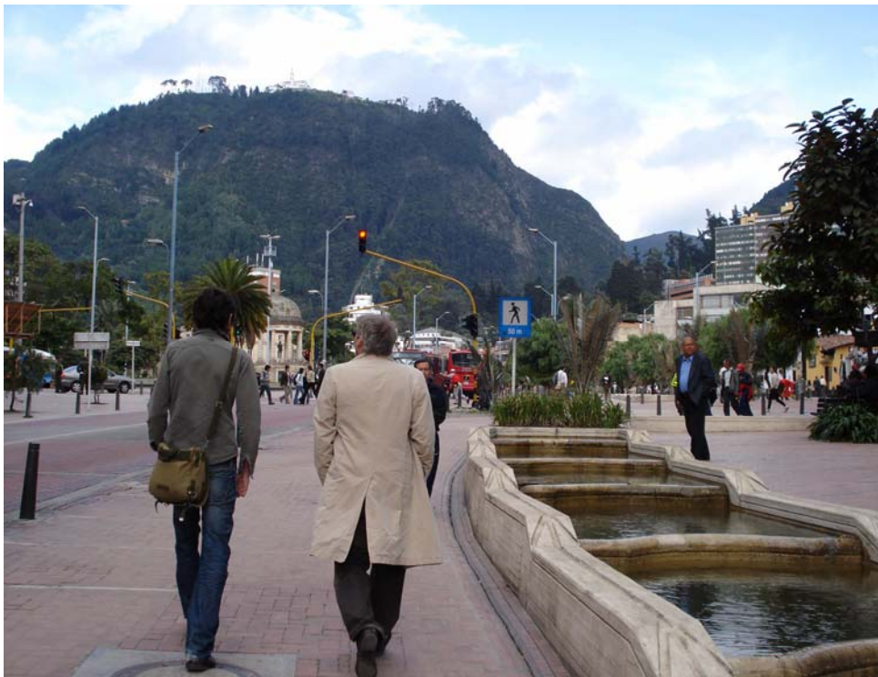
OHNO COOPERATION

Jan Lauwers: 'Dit is het kleinste project binnen Needcompany, maar voor mij even noodzakelijk als een groot project als de Sad Face | Happy Face – trilogie. De ohno -acties zijn een poetsbeurt voor mijn hersenen.'